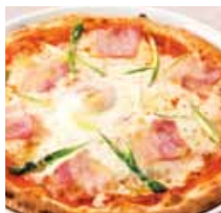
0571 ピスマルク ¥1,180