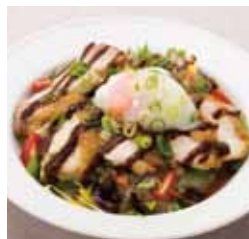
0507 イタリアン チキン丼 ¥980