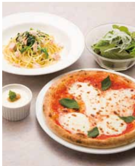
0502 半ピッツア&半パスタセット ¥1,380

※セットメニューには「有機野菜のミニサラダ」と「自家製パンナコッタ」が付きます。