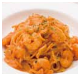
0577 海老とキャベツの トマトクリーム(スパゲッティ) ¥880