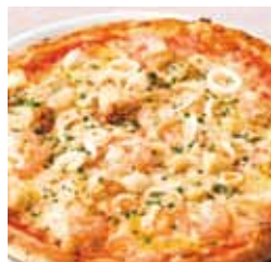
0514 ペスカトーラ ¥1,280