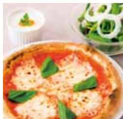
0528 レディースセット ¥980