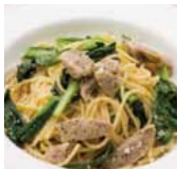
0575 イタリアンソーセージと小松菜、 チーズ風味のペペロンチーノ(スパゲッティ) ¥880